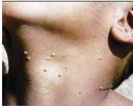
Obrázok 1. Molluscum contagiosum

tologických zmien v epidermis. Dôležité je, že vírusy spôsobujú proliferáciu epidermis v rozsahu po bazálnu membránu. To znamená, že prejavy sú povrchové, ich odstránenie si nevyžaduje hlbšiu intervenciu a hojenie po odstránení je rýchle a zvyčajne bez jaziev, ak sa nepridruží infekcia.