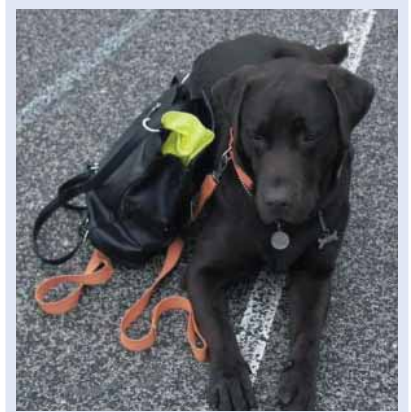
Obrázok 1. Labrador Zeus. CT pes musí vedieť trpezlivo čakať, kým príde na rad.

Keďže sa už niekoľko rokov zúčastňujem na seminároch o CT a zaoberám sa výcvikom psov, vypracovala som metódu výberu, výchovy, výcviku a následnej praxe v CT-tíme, ktorá korešponduje s osvedčenými metódami používanými v zahraničí. Je dôležité preveriť si odbornosť a spôsob práce CT-tímu skôr, ako s ním začneme spolupracovať (CT-tím = psovod + pes + odborný pracovník). Pri práci s CT musí byť vždy prítomný lekár, fyzioterapeut či iný odborný pracovník, ktorý terapiu vedie. Psovod so psom nesmú za žiadnych okolností pracovať s pacientom sami. Spôsob práce nikdy neurčuje psovod. Treba mať na zreteli, že psovod je kynológ, ktorý zodpovedá za prácu svojho psa, je plne zodpovedný za jeho správanie, zdravotný stav, hygienu a bezpečnosť. Plán, podľa ktorého sa terapia má viesť, však určuje pracovník zodpovedný za liečbu.